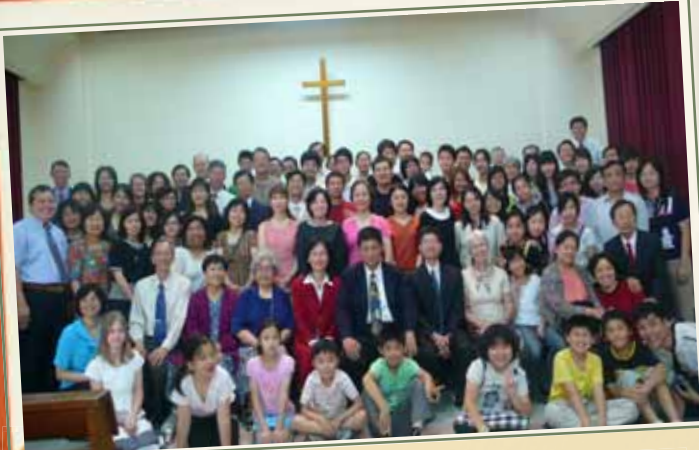
本院合作教會~中華信義會得勝堂